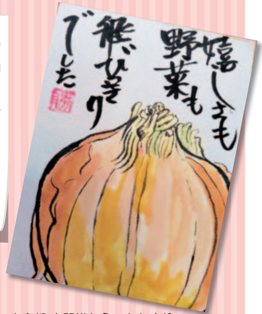
東京都 古関様からのおたより

ソーラー通信で、農業について知らなかったことを教えていただいております。日々いただいているソーラーライスですが、携わる方々の陰に日向のご苦労があってこそと、改めて感謝する気持ちです。