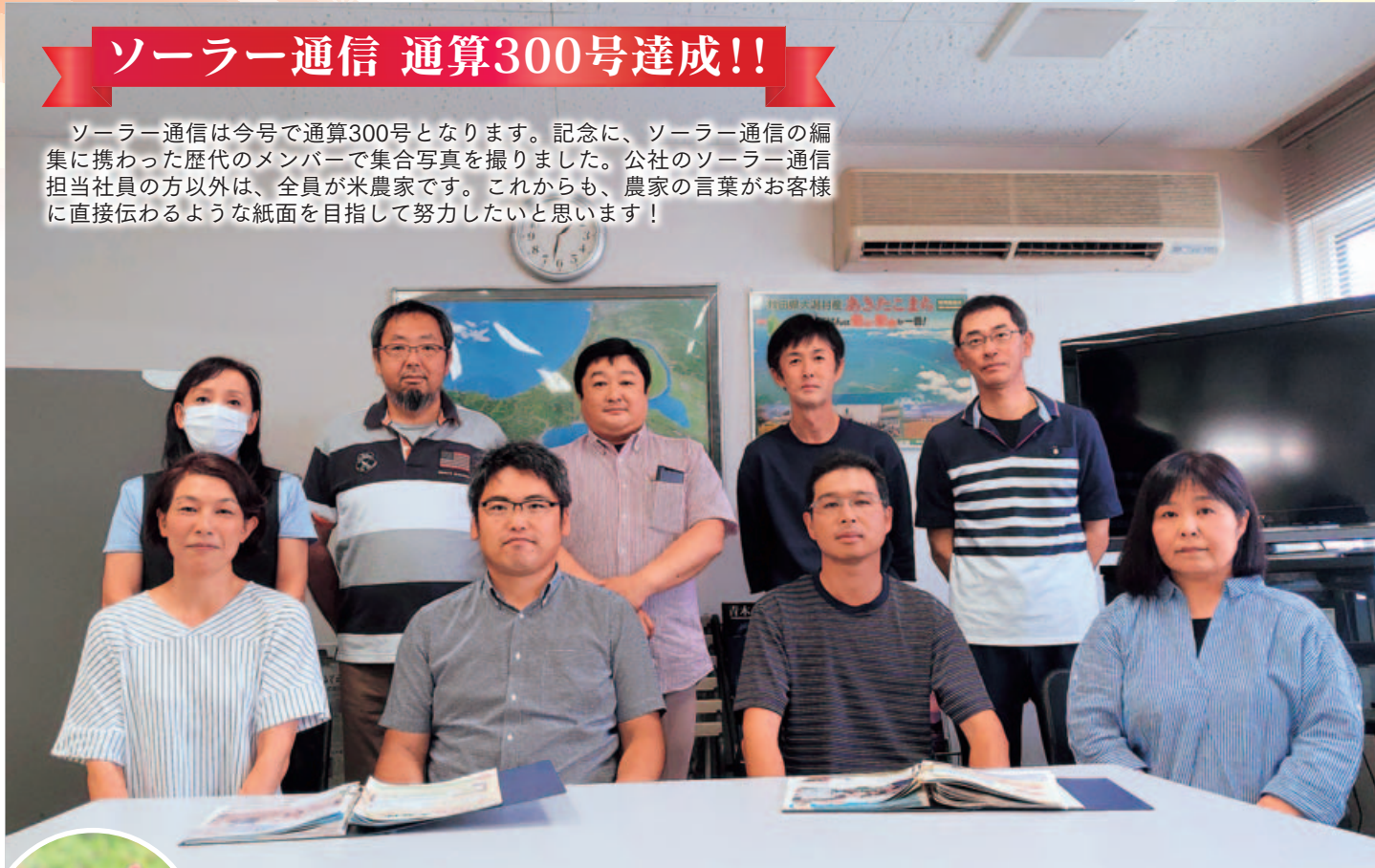
表紙写真：7月21日撮影

ソーラー通信は今号で通算300号となります。記念に、ソーラー通信の編集に携わった歴代のメンバーで集合写真を撮りました。公社のソーラー通信担当社員の方以外は、全員が米農家です。これからも、農家の言葉がお客様に直接伝わるような紙面を目指して努力したいと思えます!