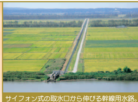
サイフォン式の取水口から伸びる幹線用水路。

また、水田は全て幹線用水路に沿って配置されているわけではありません。隅々の水田まで農業用水を運ぶために、幹線用水路から分岐した小用水路が建設されました。その総延長は、なんと449.6kmにもなります。この2種類の用水路の長さを合わせると、543.2km。東京駅から盛岡駅までの東北新幹線の距離が535.3kmですから、それよりも長いこととなります。