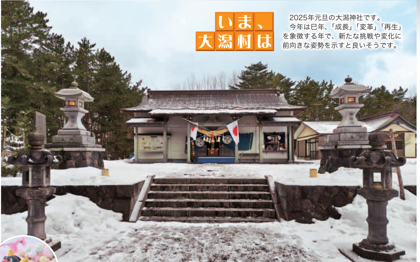
表紙写真：1月1日撮影

2025年元旦の大潟神社です。 今年巳年、「成長」「変革」「再生」を象徴する年で、新たな挑戦や変化に前向きな姿勢を示すと良いそうです。