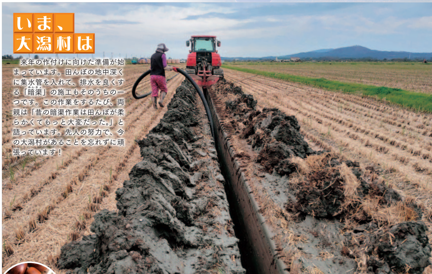
表紙写真：10月22日撮影

来年の作付けに向けた準備が始まっています。田んぼの地中深くに集水管を入れて、排水を良くする「暗渠」の施工もそのうちのひとつです。この作業をするたび、両親は「昔の暗渠作業は田んぼが柔らかくてもっと大変だった。」と語っています。先人の努力で、今の潟村があることを忘れずに頑張っています！