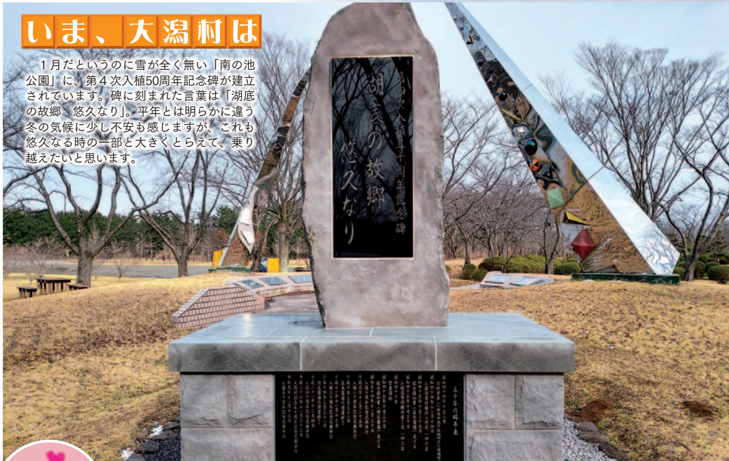
表紙写真：1月22日撮影

1月だというのに雪が全く無い「南の池公園」に、第4次入植50周年記念碑が建立されています。碑に刻まれた言葉は「湖底の故郷 悠久なり」。平年とは明らかに違う冬の気候に少し不安も感じますが、これも悠久なる時の一部と大きくとらえて、乗り越えたいと思います。