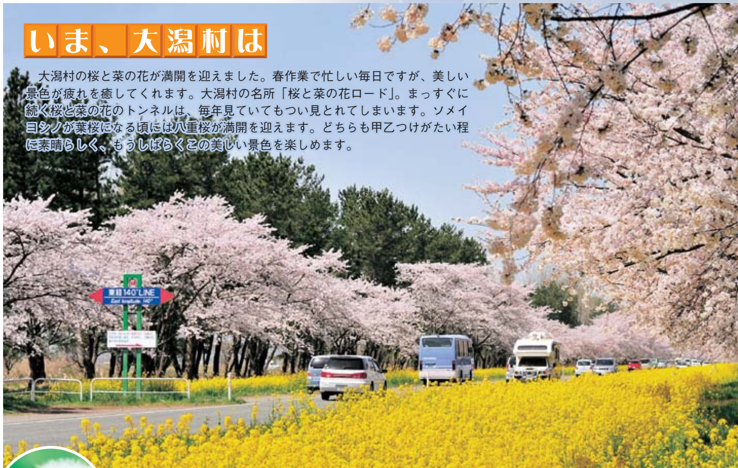
表紙写真: 4月25日撮影

大潟村の桜と菜の花が満開を迎えました。春作業で忙しい毎日ですが、美しい景色が疲れを癒してくれます。大潟村の名所「桜と菜の花ロード」。まっすぐに続く桜と菜の花のトンネルは、毎年見てもついで見とれてしまいます。ソメイ目シノが葉桜になる頃には八重桜が満開を迎えます。どちらも甲乙つけがたい程に素晴らしく、もうしばらくこの美しい景色を楽しめます。